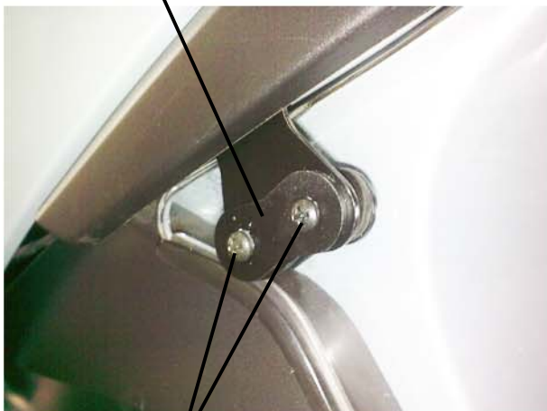
viti autofilettanti 3.9x19