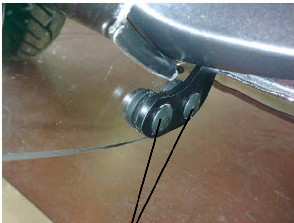
vite QST M5x14

Fermate i deflettori come mostrato dalle figure. Impuntate prima tutte le viti, posizionate il deflettore in modo che combaci con il bordo della carena e successivamente stringete bene tutte le viti. Il montaggio è ultimato.