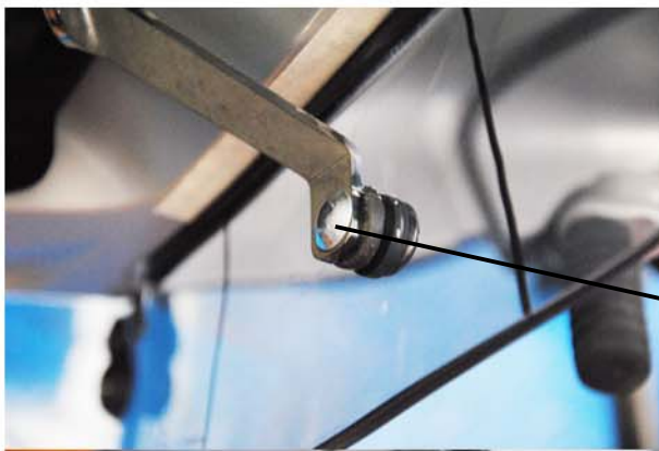
vite QST M5x14