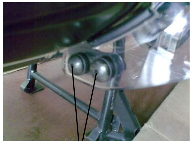
boccole filettate M5